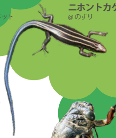
ニホントカゲ @のすり