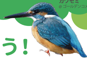
カワセミ @ゴールデンコメット