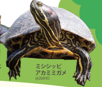
ミシシッピ アカミミガメ @26iHO