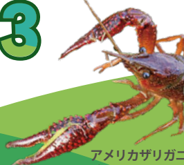
アメリカザリガニ @kyrou