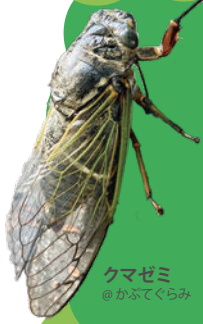
クマゼミ @かふてくらみ