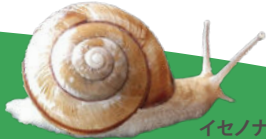
イセノナミマイ @たぬきじーりん