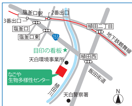
なごや生物多様性センター案内図